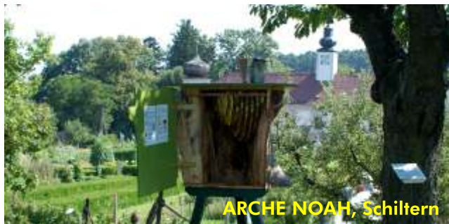
ARCHE NOAH, Schiltern

Wir sind Imker des Tiergarten Schönbrunn, der Arche Noah und der Garten Tulln, Förderer der Vielfalt und nehmen Verantwortung in der Öffentlichkeit wahr: mit Vorträgen, Schaukästen, Präsenz auf Naturgartenfesten oder beim Erntedankumzug.