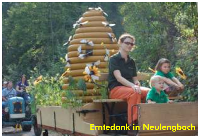
Erntedank in Neulengbach

Wir sind Imker des Tiergarten Schönbrunn, der Arche Noah und der Garten Tulln, Förderer der Vielfalt und nehmen Verantwortung in der Öffentlichkeit wahr: mit Vorträgen, Schaukästen, Präsenz auf Naturgartenfesten oder beim Erntedankumzug.